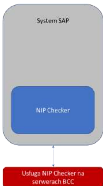
Wariant A. Połączenie bezpośrednie (D)